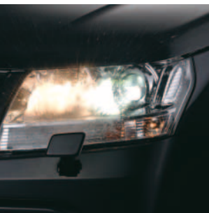
Xenonscheinwerfer mit Scheinwerfer- reinigungsanlage