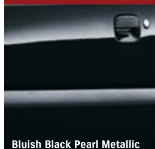
Bluish Black Pearl Metallic