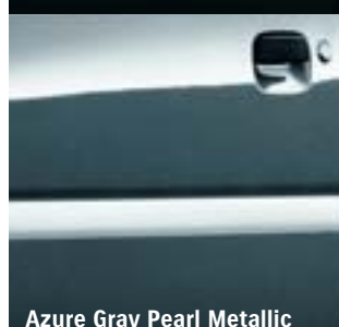
Azure Gray Pearl Metallic