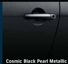
Cosmic Black Pearl Metallic