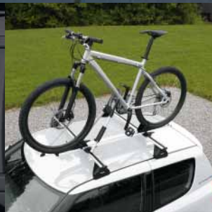
Fahrradmodul für Dachträger 7,8