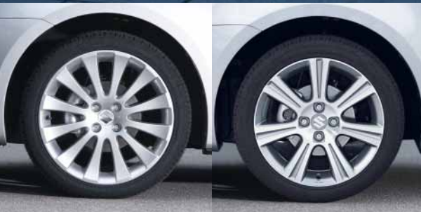
Alukomplett „Sun“ 17"