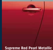
Supreme Red Pearl Metallic