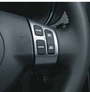
Tempomat (nur 2.0 DDiS)